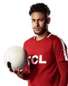
Ambasador de brand Neymar Jr.