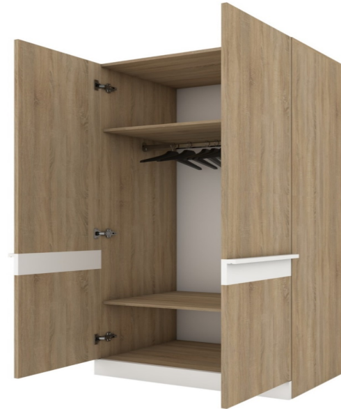
FIG. 5 „Dulap pentru haine”