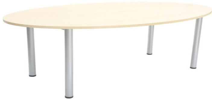
FIG. 4 „Masa ovală conferințe”